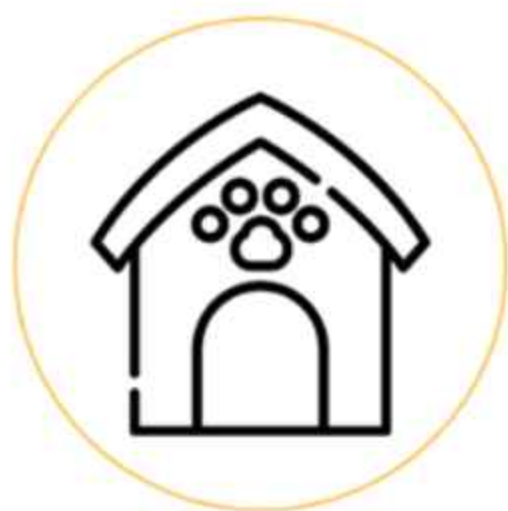
Вольеры для собак