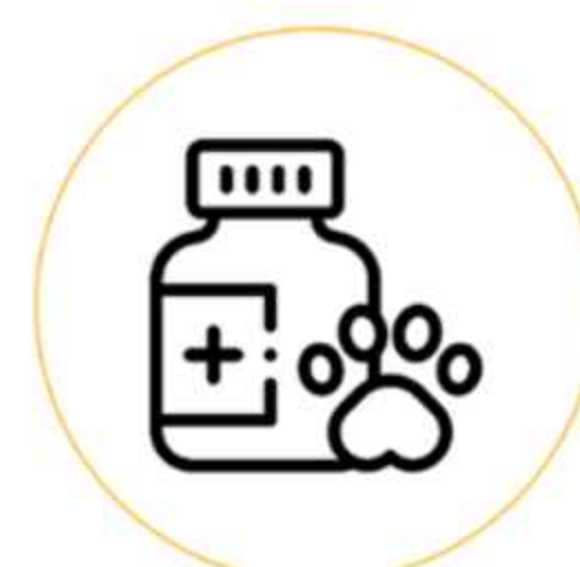
Современная ветеринарная клиника