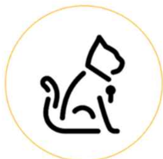
Вольеры для кошек